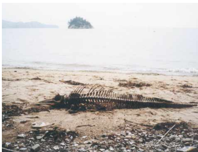
図2 津波島ピワ首海岸に打ち上げられたマイルカ。 Fig.2 View of Delphinus delphis stranded on the Biwakubi coast in Tuba island.