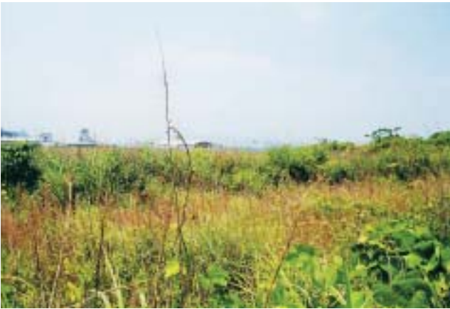
写真3 発電所構内（夏季）