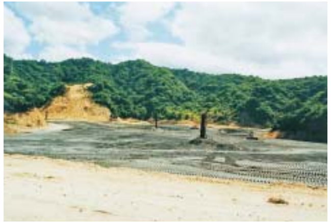
写真4 灰処分場（夏季）