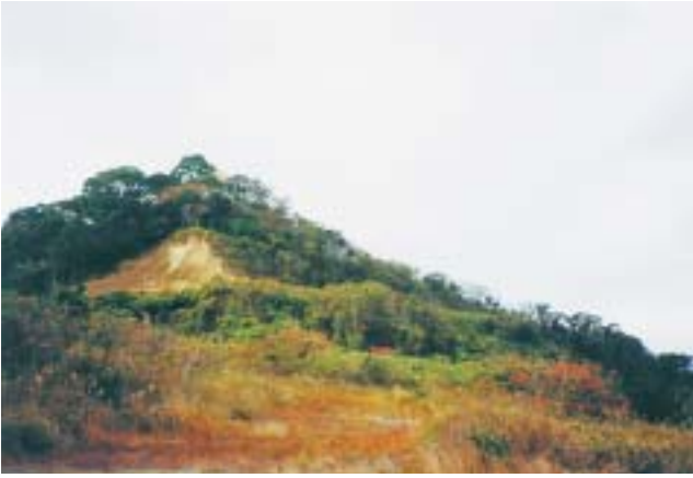
写真1 御代島（樹林地）