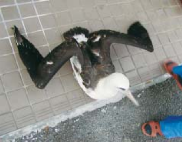
図2 背と翼の上面は黒褐色で体の残りの部分はほとんど白い