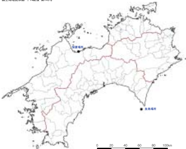
図1 黒いポイントが保護場所と放鳥場所