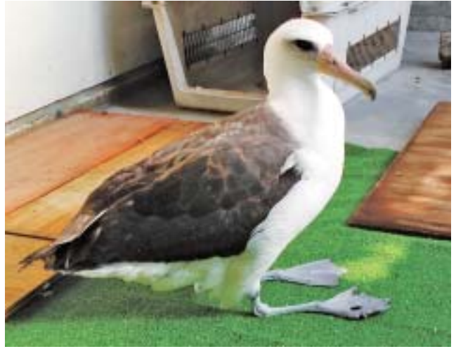
図3 特徴的な目の前の黒色と尾の先が黒い