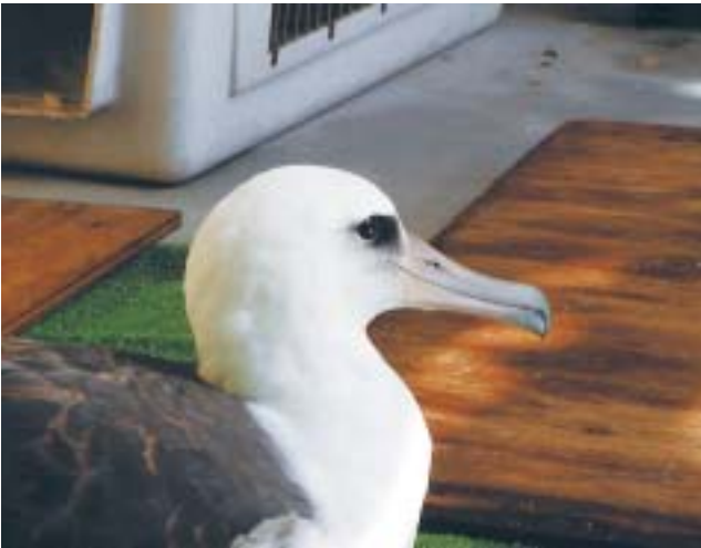
図4 幼鳥や若鳥は、嘴が灰色みを帯びている