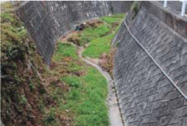
写真3 松山市小山田の生息地