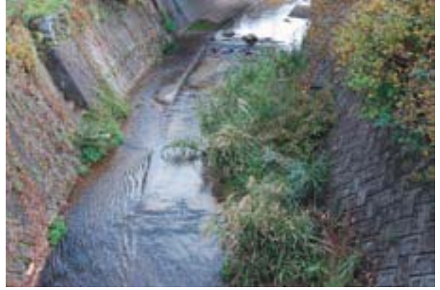
写真5 今治市玉川町御厩の生息地