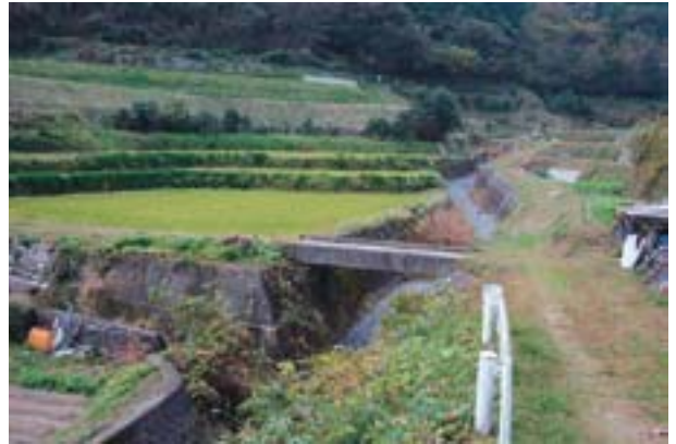
写真7 今治市野々瀬の生息地