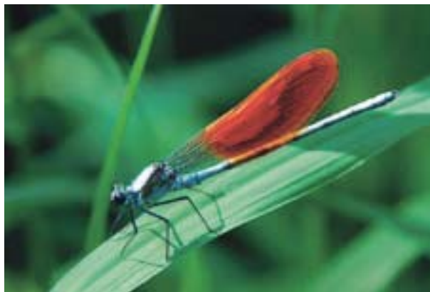
写真13 今治市菊間町中川で確認されたニホンカワトンボ(♂)