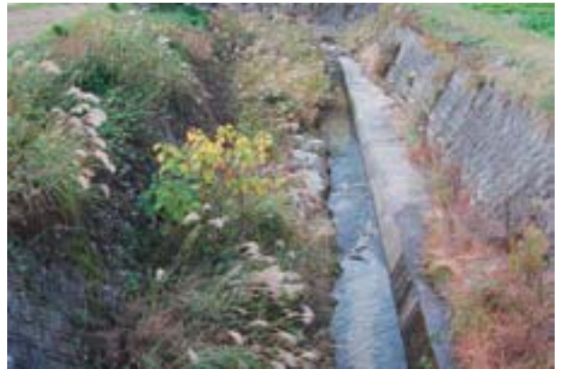
写真6 今治市玉川町御厩の生息地