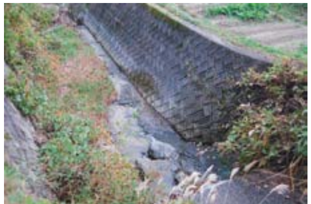
写真8 今治市野々瀬の生息地