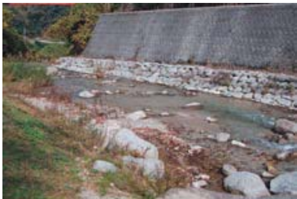
写真11 西条市河之内の生息地