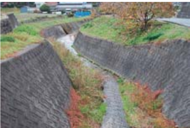
写真4 今治市玉川町鈍川日之浦の生息地