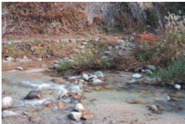
写真12 西条市河之内の生息地