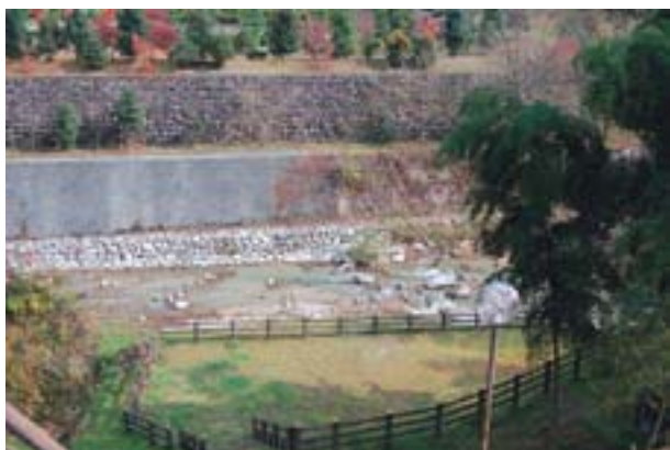
写真10 西条市河之内の生息地