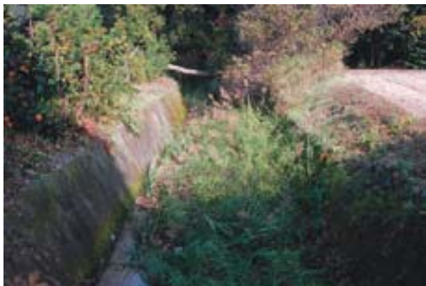
写真9 西条市河之内の生息地