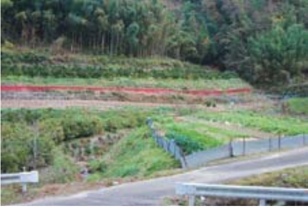
写真1 今治市菊間町中川の生息地