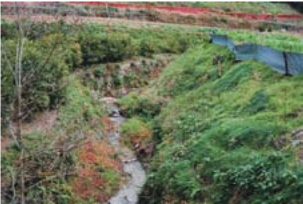
写真2 松山市小山田の生息地