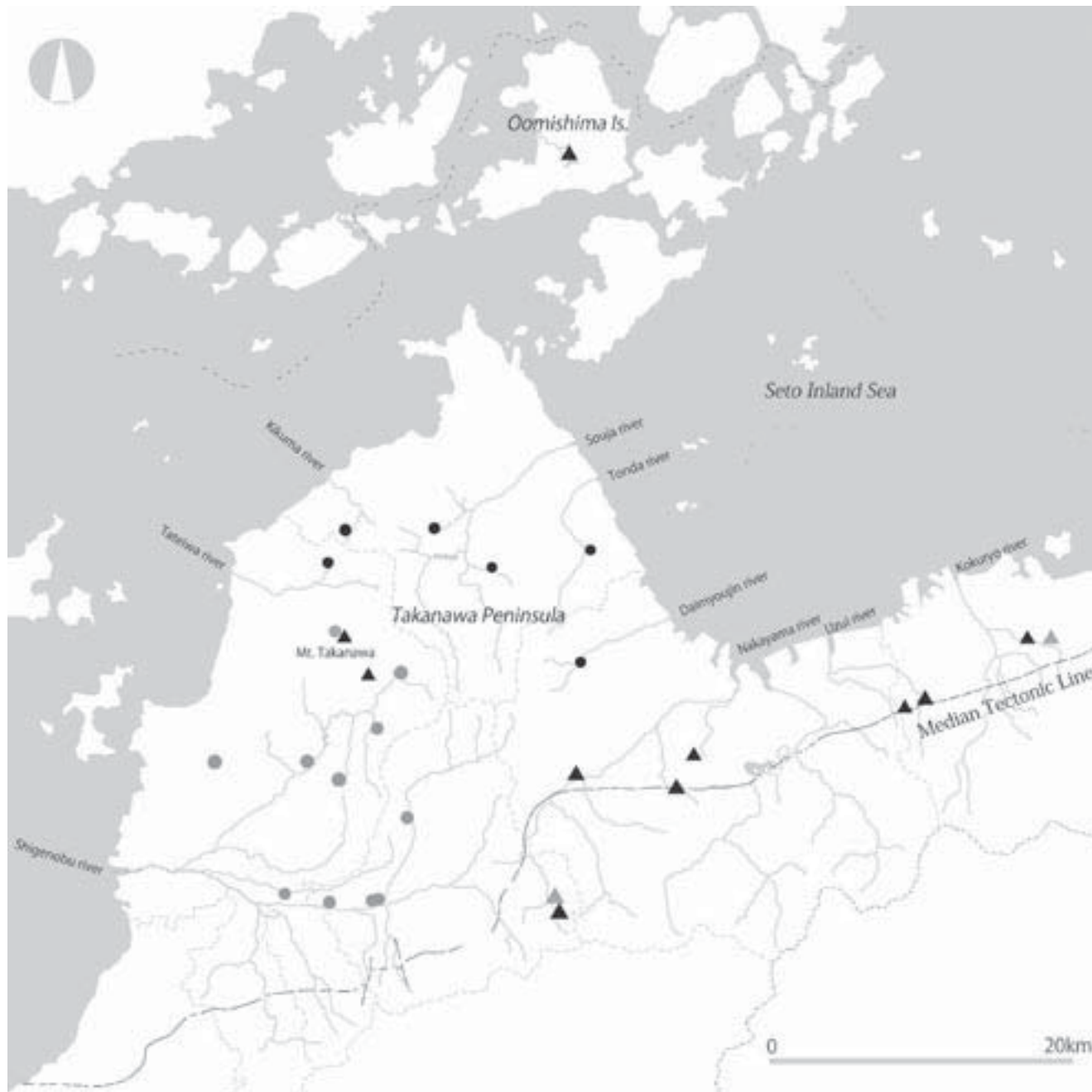
図1. ニホンカワトンボとアサヒカワトンボの記録