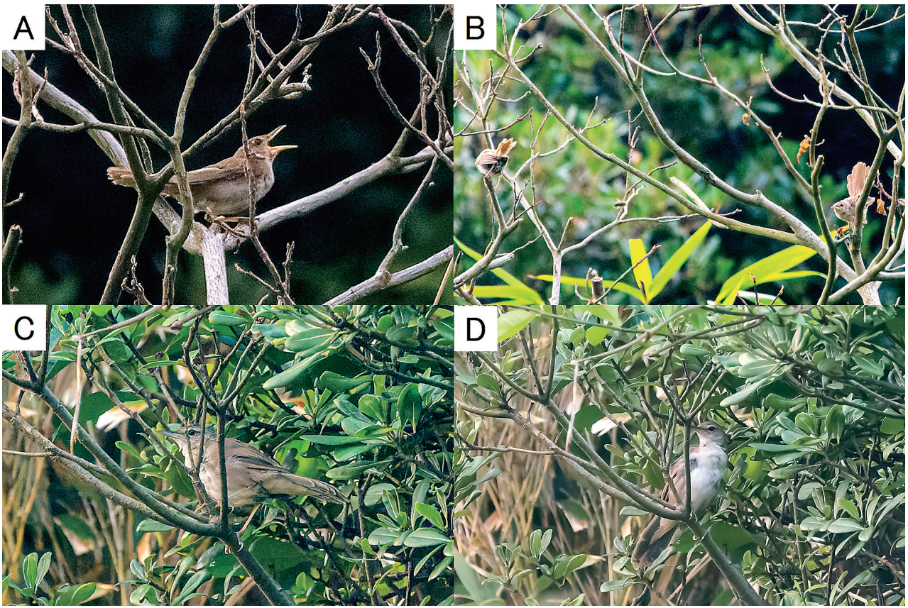
図4. 愛媛県今治市宮窪町九十九島で観察されたウチヤマセンニュウ. (A) 右側面と右下腹部, (B) ウグイス (左) に対して威嚇姿勢をとるウチヤマセンニュウ (右), (C) 左側面と脚, (D) 左側頭部, 胸部と腹部, 下尾筒と下尾羽 (2022年7月26日. 撮影: 西尾喜量)