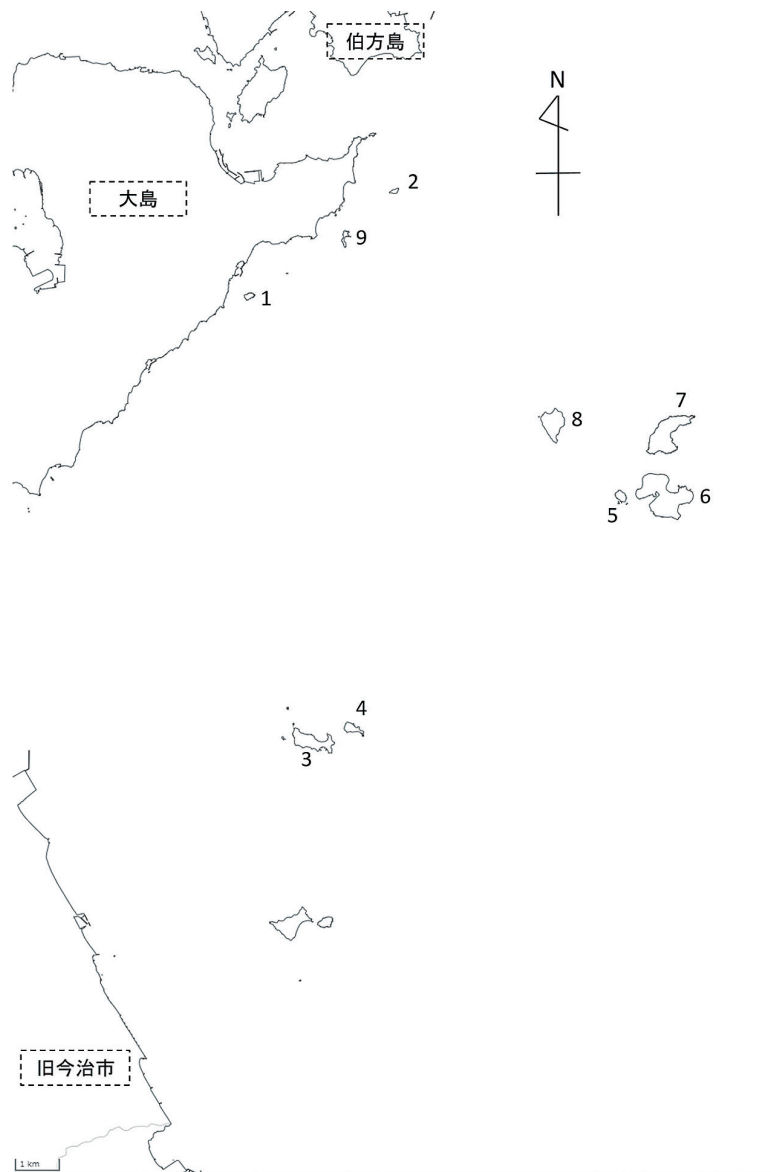
図1. 調査地 (5/31 の船上調査での調査地)

WARD, M.P. and SCHLOSSBERG, S., 2004: Conspecific Attraction and the Conservation of Territorial Songbirds. Conservation. Biology., 18, 2, p.519-525.