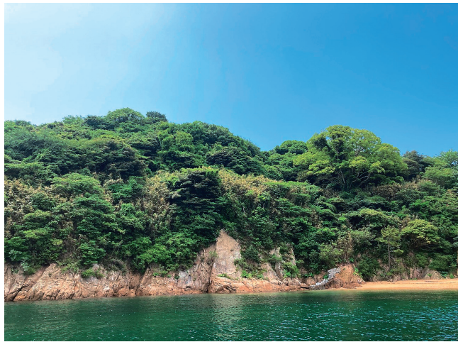
図2. 生息が確認された九十九島の北西斜面(2022年6月12日)